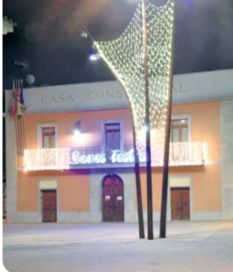
Conjunto de redes de luz led blanco cálido cubriendo una farola triple de diseño.