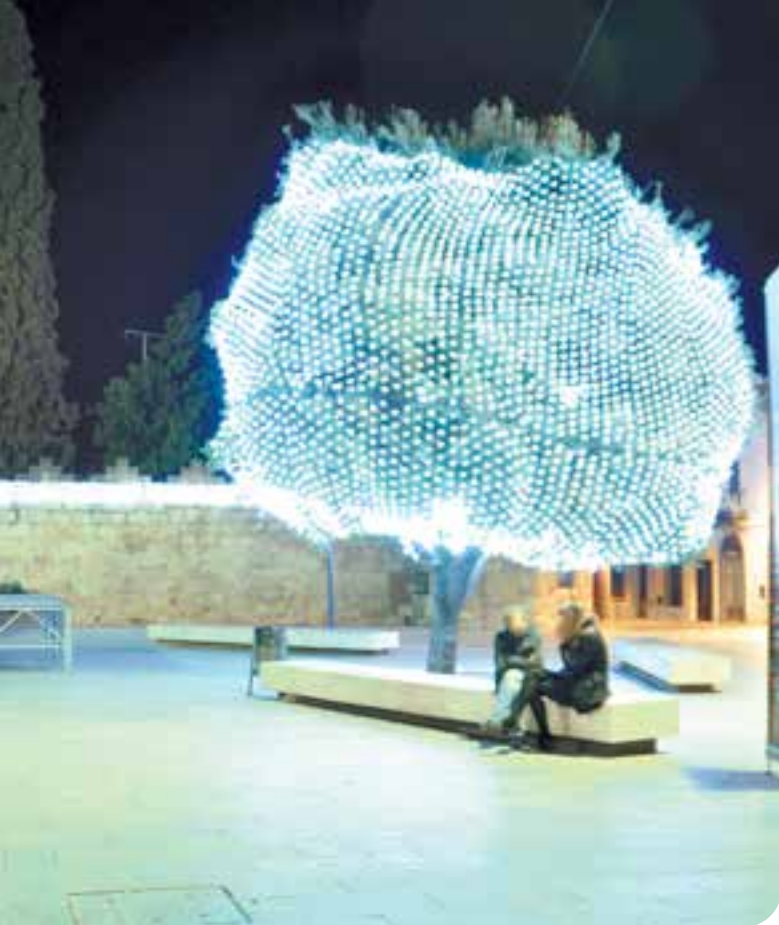
Conjunto de redes de luz led blanco unidas para cubrir la copa de un árbol.