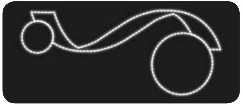
Trazado de onda simple con 2 bolas de distintos tamaños.