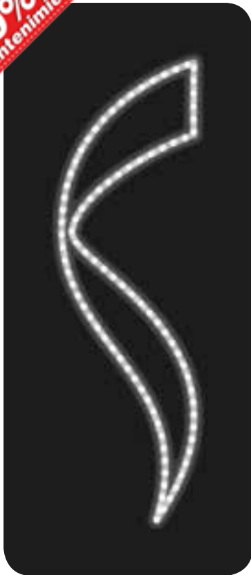
Trazado de onda simple para farola o composición de varias figuras.