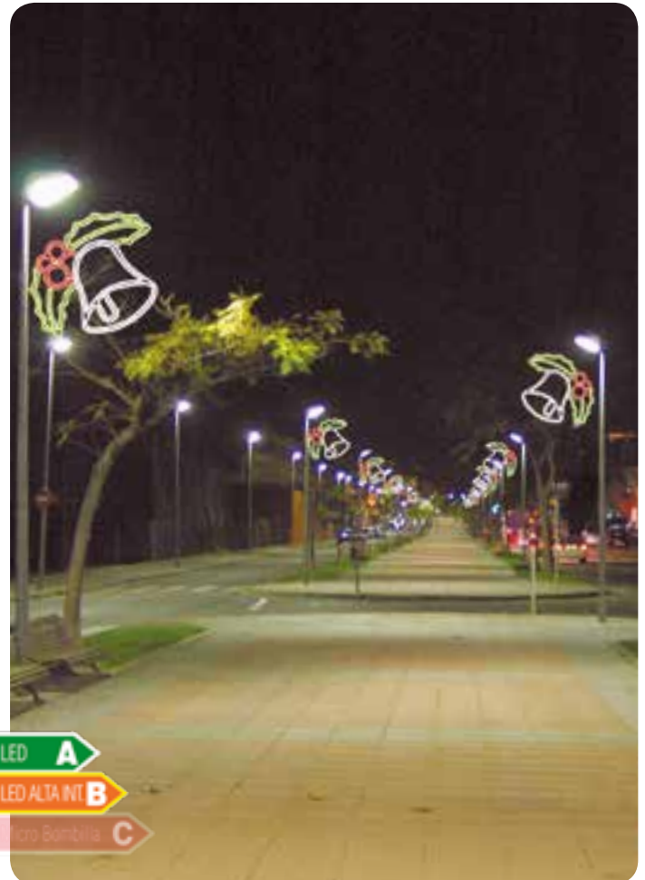
Montaje en farolas de 1 unidad de la figura "Dos campanas con lazo".