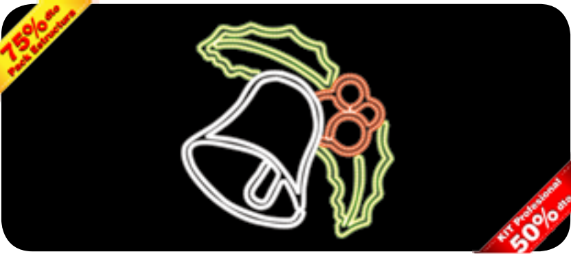
Composición de 1 campana con hojas verdes y frutos rojos.