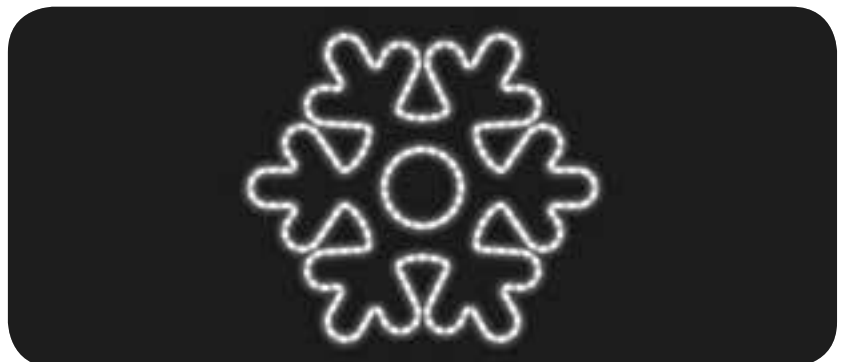
Trazado simple de un copo de nieve de 6 puntas en color blanco.