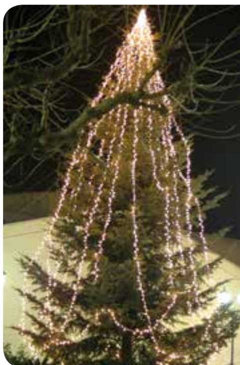
Guirnalda LED blanco cálido con caída vertical en Abeto (IBG10WWL)