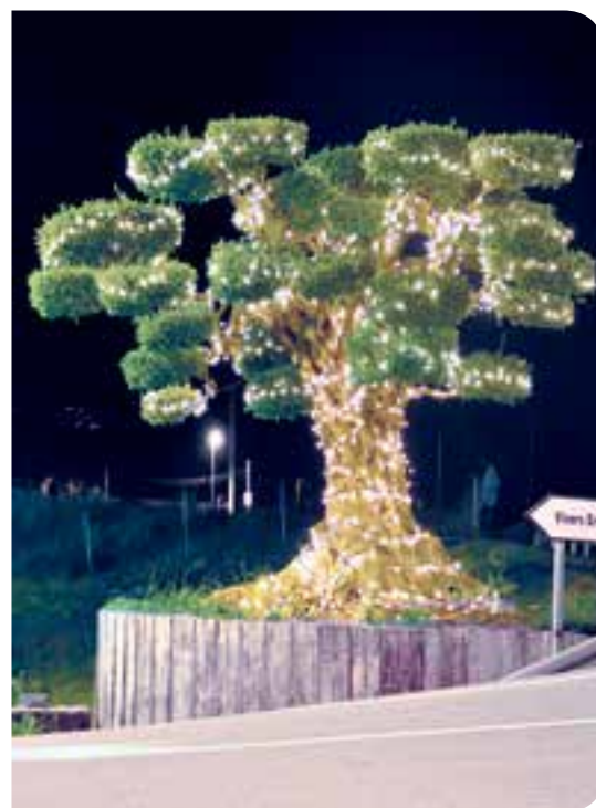
Guirnalda LED blanco cálido efecto enmarañado (IBG10GWLPC)