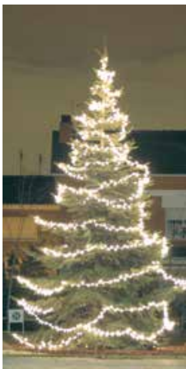
Guirnalda LED blanco caída en espiral (IBG10WLL)