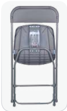
Visión trasera de la silla INTENSIVE plegada