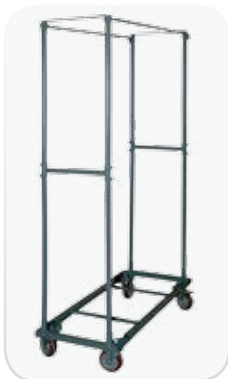
Carro modelo Vertex : Capacidad de 60 sillas modelo INTENSIVE