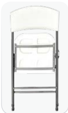
Visión delantera de la silla MIT plegada