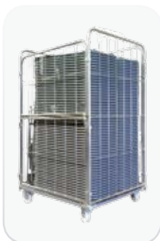
Sillas plegadas en carro modelo FLEXY