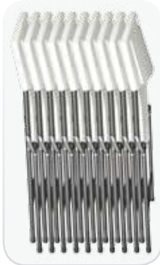
Sillas plegadas y apiladas